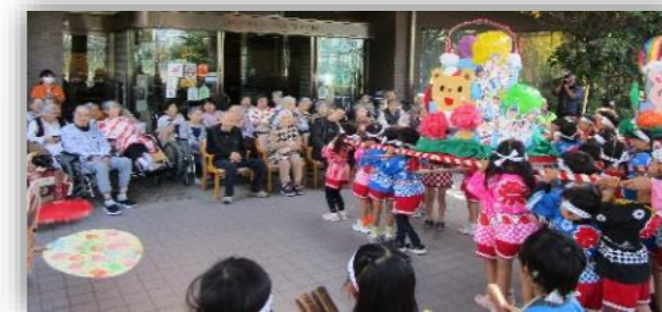
葵幼稚園おみこし

11月24日 施設の中庭にて焼き芋イベントを開催しました。水に浸した新聞紙で芋を包み、その上からアルミホイルで包む作業を入居者の皆さんに手つだってもらい、炭火でじっくりと焼き上げました。ホクホクで甘い焼き芋をおやつとして美味しく召し上がりました。