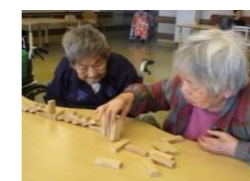
ドミノ倒しゲーム