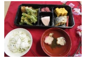
ゆうあい開所記念弁当

今年の春も当施設の前にある大同大学白水校舎の前に咲いている大きな桜の木を見にでかけました。満開のキレイな桜の花びらを見て皆さんとても喜んでおられました。木の下に設置してある白い板に反射して見える桜の影は幻想的で素敵でした。また、今年はゆうあいの里大同が開設されて21年目の年です。4月1日、当日の昼食では、施設開所記念のお弁当を皆さんに召し上がっていただきました。